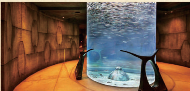
▲ Lost Chambers海底世界

• Lost Chambers海底世界 ：容量1100萬公升的水族館，更可以看見魚群暢游，且有魔鬼魚及鯨鯊在潛水員身邊游過的驚險場面吸引遊客。想發掘沉睡海底數千年的亞特蘭提斯神秘遺跡，還可以穿越大使潟湖下的迷宮一般的海底隧道。本社安排昂貴入場門票，讓你透過玻璃通道近距離觀賞65,000隻海洋生物。