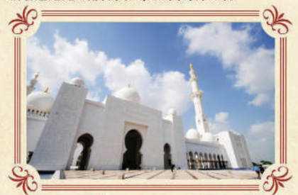
世界第三大 阿布達比大清真寺

遊覽2010年開幕之超級摩天大樓-哈利法塔，樓高828米，更安排乘搭電梯直達124/F全球最高的觀光層飽覽杜拜景色。樓層逾160層，95公里外仍可見。杜拜塔創下了多個世界紀錄，包括世界第一高樓、最高獨立建築、樓層最多、最高戶外觀景台等等。