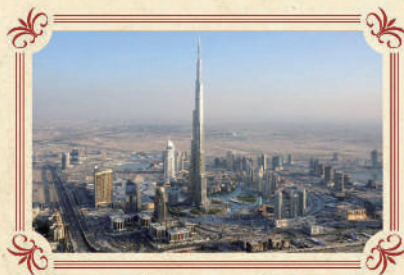
世界最高 哈利法塔Burj Khalifa

2009年中開幕，高150米，長275米，糅合了音樂和躍動水柱，變幻出1000種不同的聲光效果造型，給你震撼的視覺新享受！