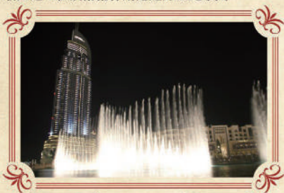
世界最大 杜拜湖音樂噴泉「Dubai Fountain」

容量1100萬公升的水族館，更可以看見魚群暢游，且有魔鬼魚及鯨鯊在潛水員身邊游過的驚險場面吸引遊客。想發掘沉睡海底數千年的亞特蘭提斯神秘遺跡，還可以穿越大使湖湖下如迷宮一般的海底隧道。本社安排昂貴入場門票，讓你透過玻璃通道近距離觀賞65,000隻海洋生物。