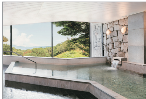
伊豆修善寺萬豪溫泉酒店