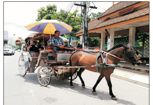
乘馬車漫遊喃邦古城