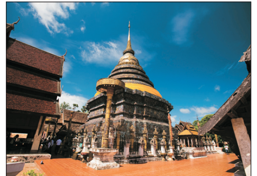
百年古城~喃邦古塔寺