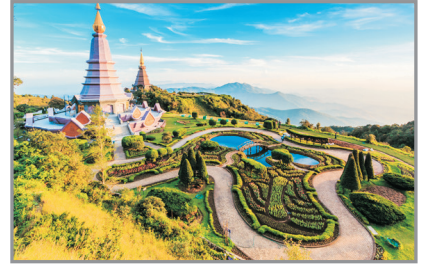
茵他儂山國家公園

清邁(茵他儂山國家公園、乘嘟嘟車遊清邁古城、大塔寺)、 百年古城—喃邦(馬車遊)、古塔寺、百年高腳屋、公雞陶瓷廠 《4人或以上自組成團，不一樣的體驗》 《不設指定購物店·免收旅行團服務費·保證廣東話導遊》