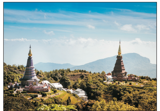
九世皇國王皇后紀念塔