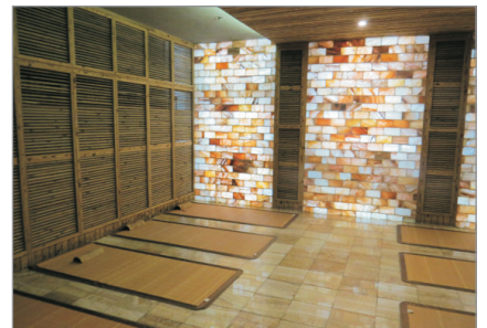
金茂海洋之星汗蒸休閒浴場