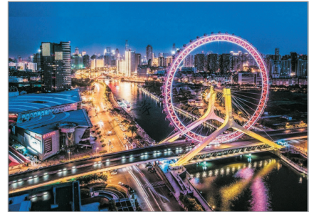
天津之眼(車上外觀)

Day 1 香港→北京【全新落成】北京大興機場—天津—車遊 天津河夜景—車上外觀天津地標~天津之眼摩天輪