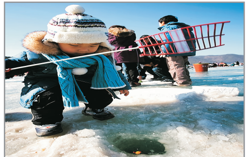
《增遊》清平冰花節(包入場+吊冰魚工具+雪兜體驗) (1月19日至2月20日出發團隊適用)

· 光明洞窟 ：「光明洞窟」走進地下黃金世界飲紅酒，洞窟當中的紅酒洞窟，設有分為保存紅酒的酒窖區與試喝兼販售的試飲區，這裡展示了韓國8個產酒地區所生產的高達78種的紅酒。除參觀炫麗的洞窟之餘，更為遊客增添味覺上的豐富享受。(AKSWS06NB適用)