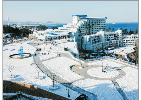
【獨家】三陟Sol Beach Hotel & Resort