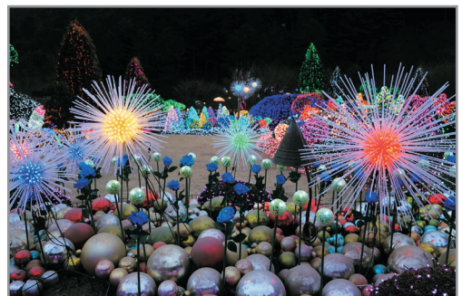
晨靜樹木園~五色星光庭園展