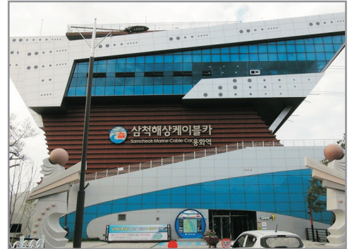
莊湖港海上纜車體驗