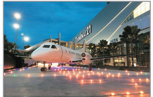
Grande Centre Point Pattaya

《永安獨家入住曼谷市中心豪華五星級 Grande Centre Point Hotel Ploenchit二晚》