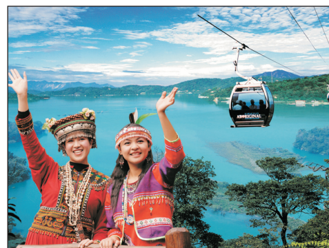
九族文化主題樂園