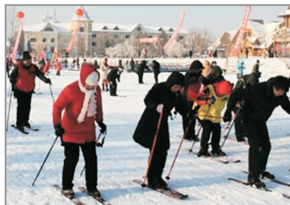
伏爾加莊園滑雪場