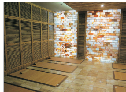
金茂海洋之星汗蒸休閒浴場