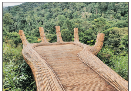
打卡熱點~巨型幸運之手