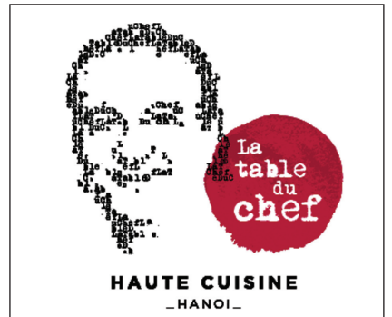
米芝蓮二星廚師推介~Press Club