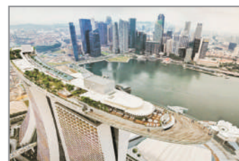
金沙空中花園觀景台