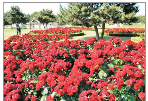
日立海濱公園玫瑰花