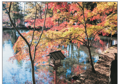
出流原弁天池湧水