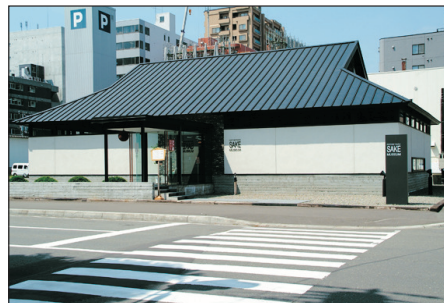
千歲鶴清酒博物館