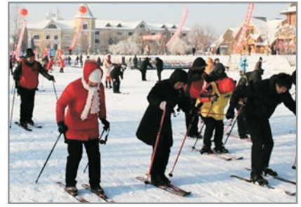
伏爾加莊園滑雪場