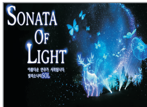
SONATA OF LIGHT 3D燈光秀