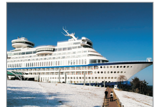
【獨家】Sun Cruise Hotel & Condo