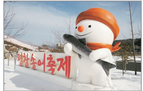
《增遊》平昌鱒魚節 (2019年12月20日至2020年1月31日出發團隊適用)