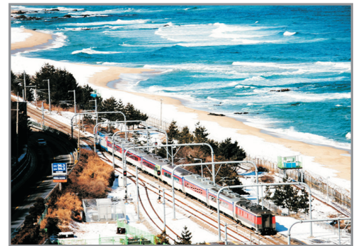
正東津臨海火車體驗