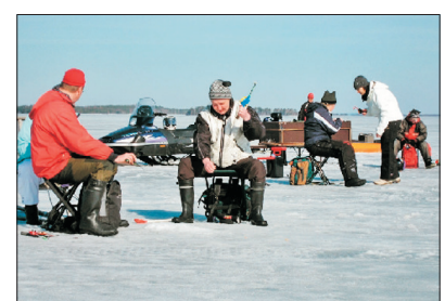
「獨特體驗」冰上垂釣

探訪聖誕老人村，一睹傳說中聖誕老人的真面目，村內所有建築物都是充滿童話色彩的歐陸式木屋。團友可在北極圈分界線拍照留念，更可獲得一張到達北極的證書。村內的聖誕老人郵局亦是必遊之處，除了有多項設計精美的聖誕郵票及精品外，團友更可自費填表，便可以在聖誕節收到聖誕老人寄來的賀節信件。