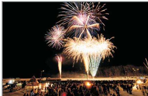
阿寒「冬華美」第45回冰上祭