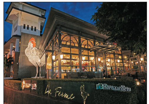
人氣推介~La Ferme Pattaya