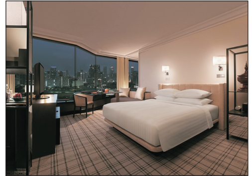
Grand Hyatt Erawan Bangkok