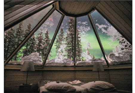
Glass-Roof Aurora Cabins玻璃酒店