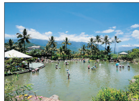
立川漁場~摸蜆體驗