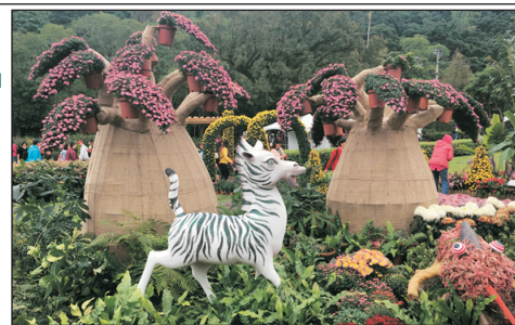
增遊士林官邸秋季菊展

下田拔蔥(蔥油餅DIY)、七星潭、總統府、上引水產、林口三井Outlet、士林夜市