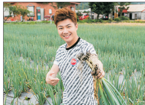
下田拔蔥+蔥油餅DIY體驗

(11月10,11,15,17,18,22,24,25日、12月1,8,15日首團出發適用)