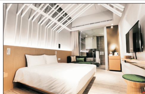
免費提升入住品文旅礁溪酒店