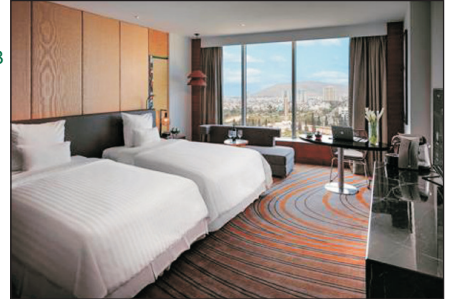
Pullman Vung Tau Hotel