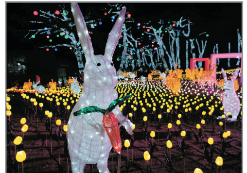
丹陽垂楊介星光隧道