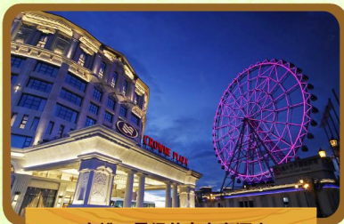
高雄五星級義大皇家酒店

環抱觀音山悠悠綠意，是全台唯一結合休閒度假飯店、大型購物商場、主題遊樂園和藝術生態於一體的多元化度假休閒勝地。