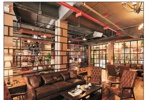
W22 by Burasari Hotel