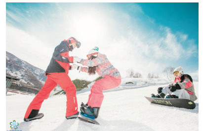
崇禮雲頂樂園滑雪場

# 龍慶峽冰燈藝術節舉辦日期為1月15日至2月底，確實完結日需視乎天氣等各種因素，以官方公佈為準。如未能前往龍慶峽冰燈藝術節，將改為遊覽八達嶺長城(包纜車)(註5)