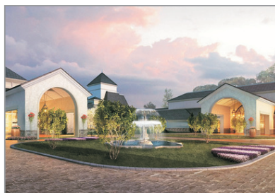
懷來皇冠假日酒店