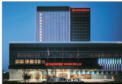
北京富力萬達嘉華酒店