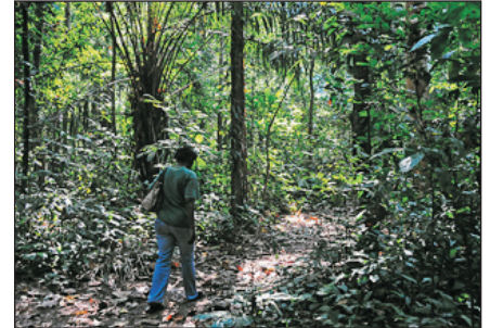
塞姆利基國家公園