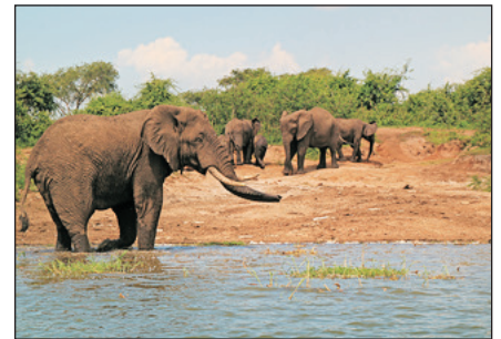
伊利莎伯女皇國家公園