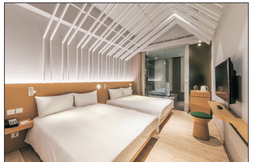
品文旅礁溪溫泉酒店