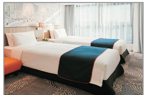
Holiday Inn Express Seoul Hongdae Hotel