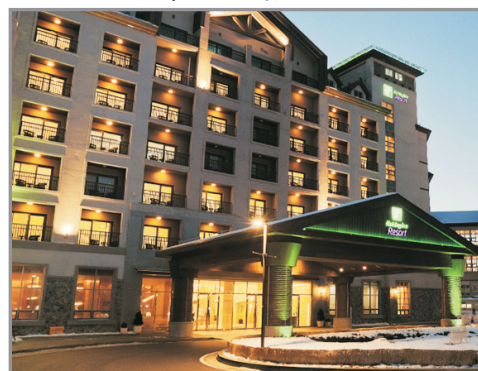
Holiday Inn Resort Hotel