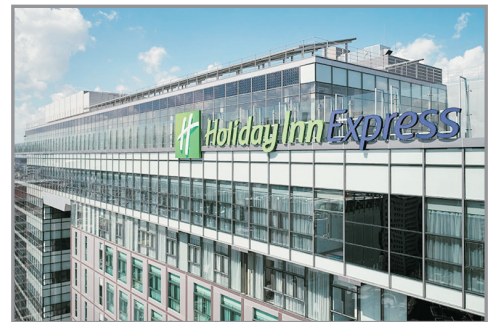
Holiday Inn Express Seoul Hongdae Hotel