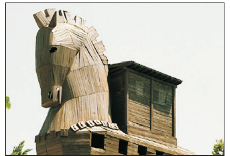
世界文化遺產～特洛伊古城