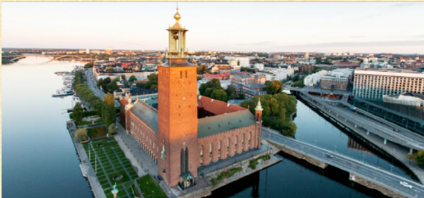
▲ 市政廳(諾貝爾獎頒獎典禮舉行地)