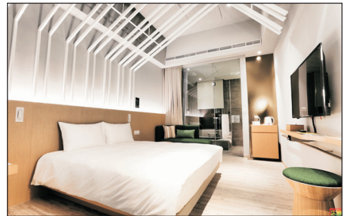
品文旅礁溪酒店 每間客房均備溫泉浴池， 客人於房內即可隨興浸浴溫泉。