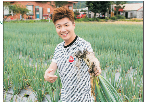
下田拔蔥+蔥油餅DIY體驗