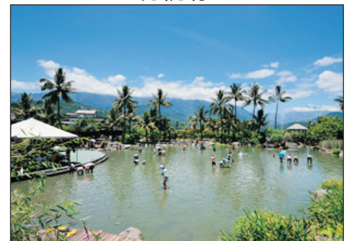
立川漁場~摸蜆體驗