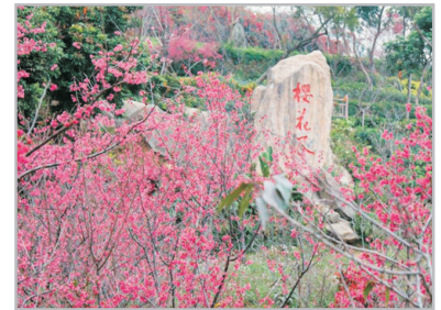
海滄大屏山櫻花(2月26日至3月15日出發增遊)

漳州—惠和石文化園(包觀看惠安女風情表演)(遊覽時間約1小 時)(即日起至2020年2月5日及3月16日起出發適用)/角美賞油菜花(2月6日至 3月15日出發適用)—五緣灣濕地公園(遊覽時間約40分鐘)(即日起至2020年 2月25日及3月16日起出發適用)/海滄大屏山賞櫻花(2月26日至3月15日出 發適用)—《世界文化遺產》鼓浪嶼(包乘渡輪往返)【遊覽 萬國建築群(外觀天主教堂、美國式別墅、原日本領事館) —龍頭路商業街】(遊覽時間約3.5小時) ~惠和石文化園: 集石雕藝術展示、藝術創作、文化交流、旅遊休閒與教育學習為一 體的綜合性園區, 領略中華石文化與閩南文化魅力。觀看惠安女風情表演, 更可感 受惠安萬種風情和奇異民俗。 *漳州至廈門, 車程約1小時。