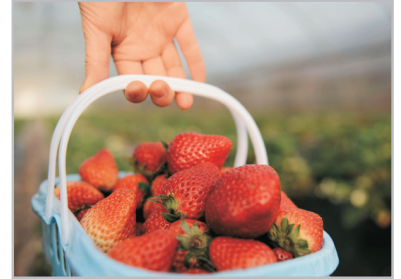
果園採摘草莓(園內任摘任食) (2月6日至3月15日出發增遊)

香港西九龍站集合—(乘坐高鐵動感號/和諧號列車)#— 漳州*—永定—《世界文化遺產》永定高北土樓群【承啟樓、 世澤樓、五雲樓】(遊覽時間約1小時)—體驗客家打糍粑(遊覽時 間約20分鐘)—夜遊精品土樓~和興樓【包品嚐地道燒烤 (肉類及蔬菜各兩款), 啤酒任飲及K歌助興】(遊覽時間約2小時) #如香港前往漳州之直達列車滿座, 將安排於深圳北站轉乘和諧號前往漳州, 有關安 排將由領隊於出發前通知, 客人不能藉此要求退出或要求賠償。 *本團有機會採用廈門站、廈門北站、漳州站進出, 車程約4-4.5小時 *漳州往永定, 車程約2.5小時。