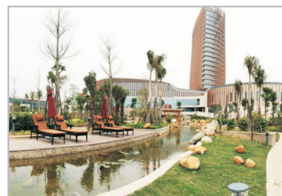
佰翔圓山溫泉酒店