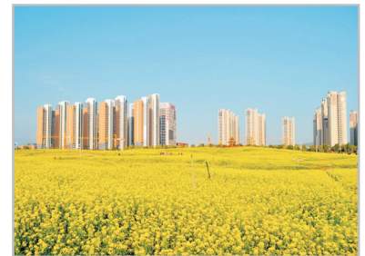
角美油菜花(2月6日至3月15日出發增遊)

永定—永定民俗文化村【振成樓、福裕樓、奎聚樓、 如升樓】(遊覽時間約2小時)—漳州—明清一條街、孔廟(遊覽時 間約1.5小時)—包享用酒店溫泉1次(註23) *永定至漳州, 車程約2.5小時。