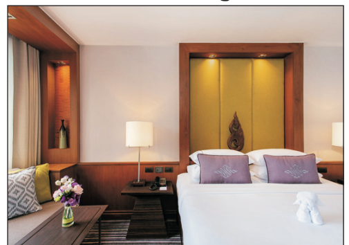
The Sukosol Bangkok Hotel