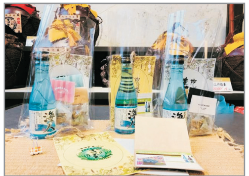
手工花茶+泡盛酒藏工場見學