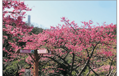
季節限定：增遊八重岳~觀賞全日本最早櫻花(註5)

保證入住1晚沖繩沙灘度假酒店、海洋博公園、名護菠蘿園、萬座毛海岸、知念岬公園、Niraikanai大橋(途經)、手工花茶DIY+泡盛酒藏工場見學、人氣Cafe~姜黃花、珊瑚養殖體驗+工場見學、Ashibinaa Outlet、《全新購物熱點》Parco City 《新春出發：2020年1月22,26日出發(年廿八、年初二)》