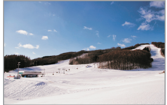
北見Northern Arc Ski Resort

《保證入住2晚北見Northern Arc Ski Resort》 網走～破冰船體驗流冰之旅、野外攀山雪車場、 山之水族館、北見狐狸村、層雲峽冰瀑祭、 四季彩之丘～可愛羊駝牧場、男山酒造資料館 《新春限定：2020年1月26日(年初二)》