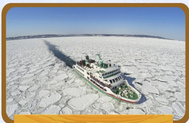
破冰船體驗流冰之旅