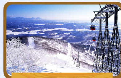
溫泉、滑雪，享受冬日樂趣

前往網走乘搭大型破冰船，近距離觀賞千變萬化的流冰，感受船底碾過流冰的震撼感覺，令人畢生難忘！除了令您嘆為觀止的壯麗流冰景觀外，更有機會看到躺在流冰上歇息的可愛海豹及空中翱翔的海鷗。破冰船上更設有咖啡室及商店，提供舒適的環境，讓您悠閒休息及暖和身體。(註3) (2020年1月20日-3月31日出發適用)