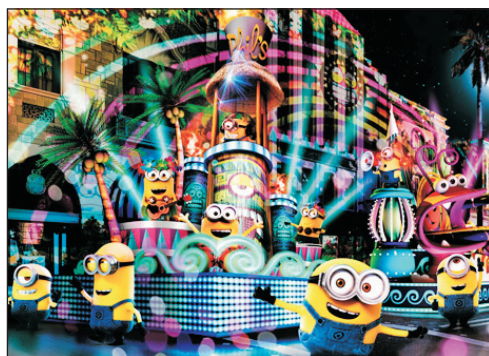
環球影城～「迷你兵樂園」