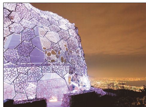
六甲山垂枝展望台夜景

• 關西最大型！約一萬平方米的雪地，可以盡情享受滑雪、滑雪板、玩雪等冬日休閒。滑雪場坡度平緩，更特別設雪兜、玩雪的專用場所，是一個適合小朋友戲雪玩樂的地方。