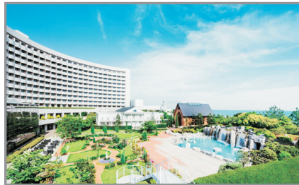
Sheraton Grande Tokyo Bay酒店外觀