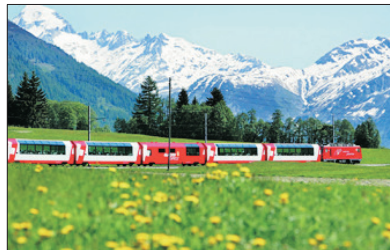
「豪華列車體驗」 冰河列車

乘吊車登山前往被聯合國列入「世界自然遺產」～阿萊奇冰川觀賞鄰近的美景，長達23公里，是阿爾卑斯山脈中最長及最美麗的一條冰川。