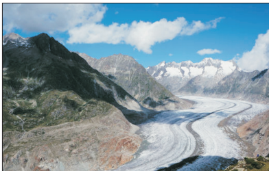
「世界自然遺產」 阿萊奇冰川

乘吊車登山前往被聯合國列入「世界自然遺產」～阿萊奇冰川觀賞鄰近的美景，長達23公里，是阿爾卑斯山脈中最長及最美麗的一條冰川。