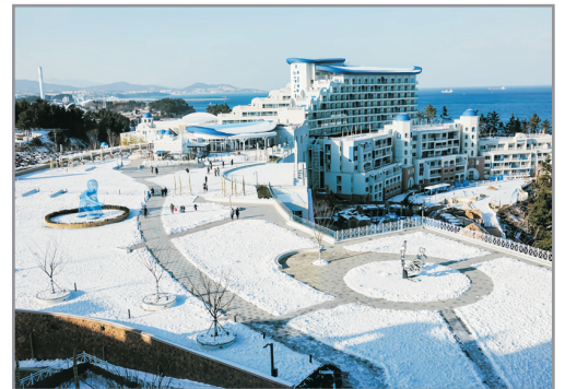
【獨家】三陟Sol Beach Hotel & Resort