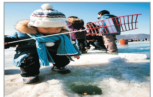
《增遊》清平冰花節(包入場+吊冰魚工具+雪兜體驗) (1月19日至2月20日出發團隊適用)