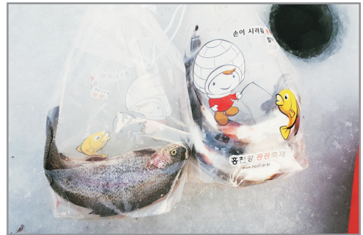
《增遊》洪川人蔘鱒魚節 (1月3日至18日出發團隊適用)