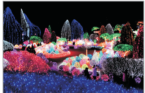
《增遊》晨靜樹木園~ 五色星光庭園展 (12月7日至1月2日出發團隊適用)

劃分為4大區域：極限運動區、沖浪區、激情活力區及超速滑道區，提供各種刺激好玩娛樂設施，讓您樂而忘返！另外，還配備汗蒸房、桑拿區、治療中心及SPA等，為您放鬆身心舒緩疲勞。