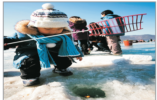
《增遊》清平冰花節(包入場+吊冰魚工具+雪兜體驗) (1月19日至2月20日出發團隊適用)