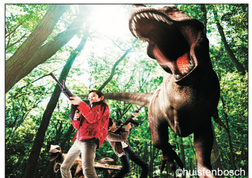
豪斯登堡(AR恐龍射擊體驗)