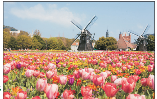
豪斯登堡~大鬱金香祭 (2月8日起出發適用)(註2)

豪斯登堡(任玩套票及入住1晚機械人酒店、期間限定~大鬱金香祭)、 九重夢吊橋、湯布院懷舊溫泉街、九州自然動物公園非洲Safari體驗、 宇佐神宮、杵築城下町散策、福岡、太宰府天滿宮、鳥栖Premium Outlets 《出發日期：2020年1月18日，2月1,8,15,22,29日，3月7,14,21日》