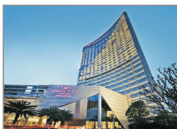
漳州融信皇冠假日酒店