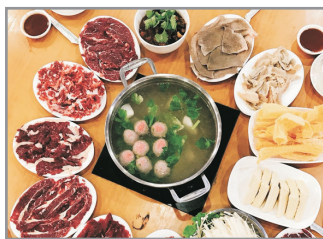
現切汕頭牛肉火鍋宴