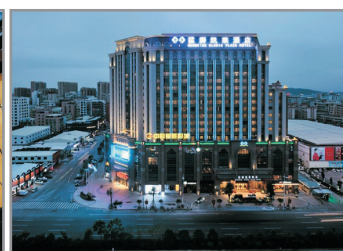
汕頭澄海猛獅凱萊酒店