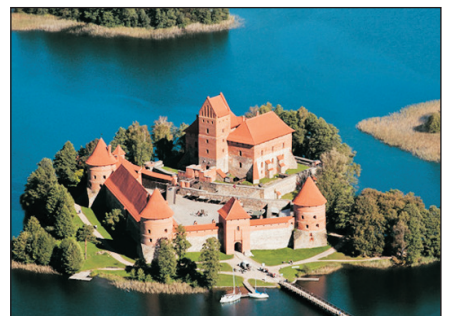
特拉凱城堡歷史博物館

Brest-Mir Krasnoarmeyskaya(Internal Visit)-Minsk-Victory Square-Church of Holy Trinity(External Visit) · 米爾城堡 ：城堡於15世紀末動工，在16世紀初完工，最初是一座哥德式建築，其後因接管人的更換和受戰火的嚴重破壞而重建，使建築風格融合了各階段的哥德式、巴洛克、及文藝復興式，締造出非凡歷史性建築遺跡。 · 明斯克 ：是白羅斯的首都，位於白羅斯的中心。明斯克是白羅斯的政治、經濟和文化中心，擁有多個高等院校，包括白羅斯國立大學。此外還有著名的馬戲團、歌劇院和芭蕾舞院。