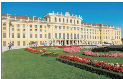
「維也納著名景點」 美泉宮御花園

參觀音樂之都~維也納著名之美泉宮御花園。位於宮外的御花園優雅細緻，延用皇宮所採用的巴洛克建築風格，中軸的花園大道旁，種滿色彩繽紛的花卉及整齊的綠樹牆，盡頭是一座海神像的噴泉。