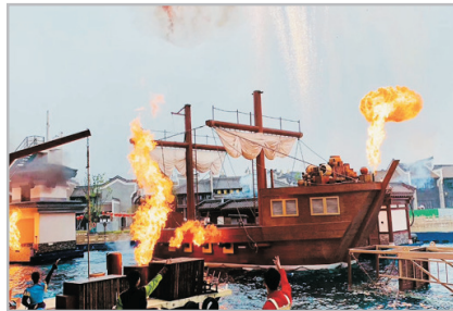
黑石號水上特技秀