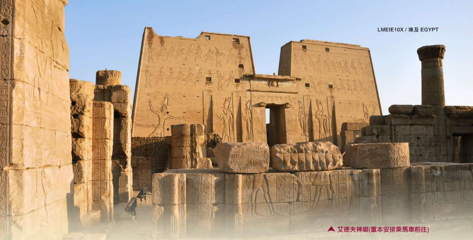
▲ 艾德夫神廟(重本安排乘馬車前往)