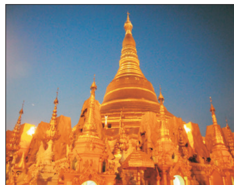
大金塔(包入場參觀)