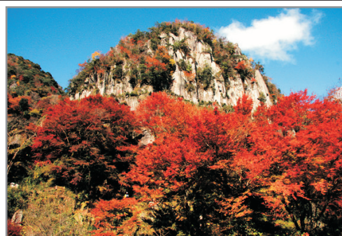
《增遊》最新紅葉打卡熱點・「賞紅葉名所」耶馬溪 (10月24日至11月28日出發適用)(註3)