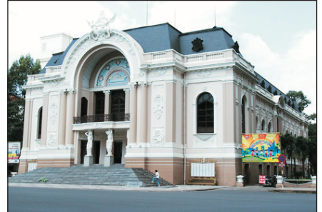
法國風情的市立歌劇院

古芝地道、戰爭博物館、湄公河三角洲、熱帶水果園、耶穌山、 鯨魚廟、Vincom Center、歷史博物館、3D視覺美術館、統一宮